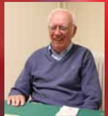
Erik hittade på S:t Erik Sid 6